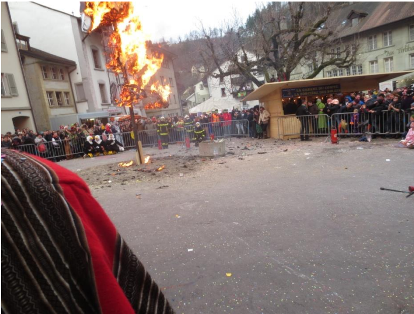
Feu du Rababou lors du Carnaval des Bolzes, le 2 février.

Pour l'année 2014, notre personnel a été sollicité pour diverses manifestations qui ont eu lieu sur notre territoire, afin d'en assurer un déroulement dans les meilleures conditions au niveau du risque incendie.