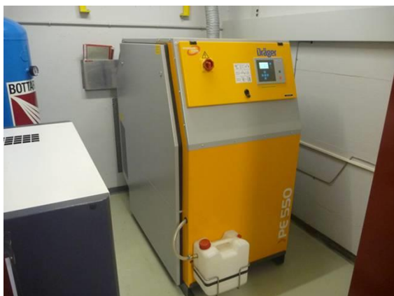
Remplacement du compresseur pour le remplissage des bouteilles pour la protection respiratoire qui datait de 1981