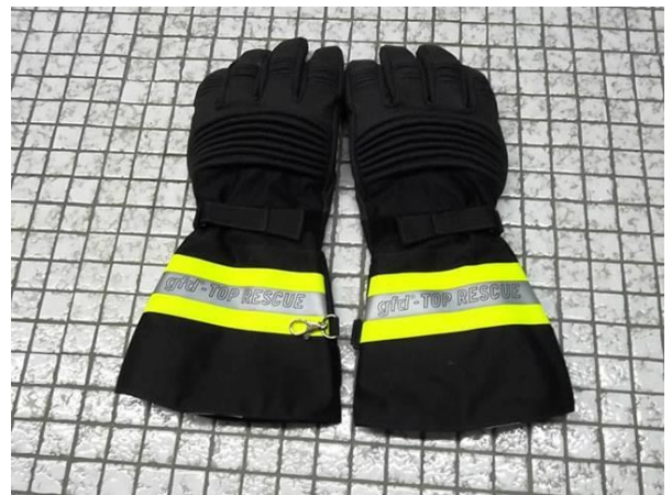
Achat de 12 tenues d'intervention, 30 paires de gants, 30 casques