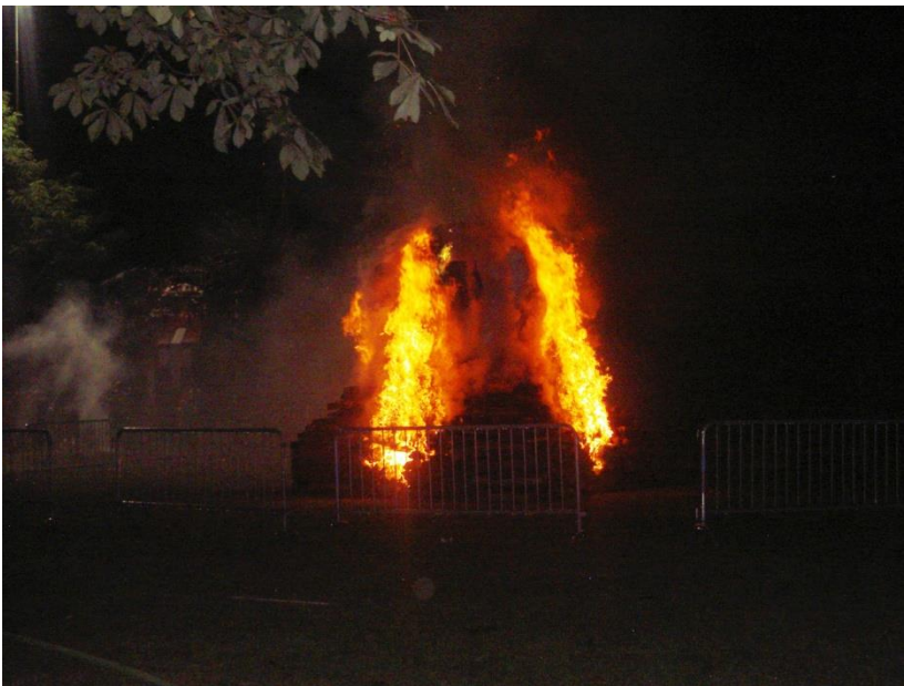
1 er août, le feu de la Fête Nationale qui s'est déroulée aux Grandes-Rames.