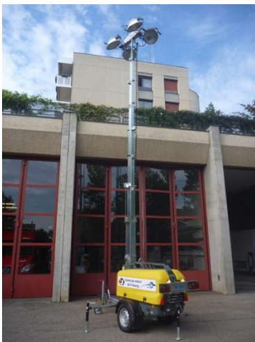
Remplacement de la tour d'éclairage de 1972 par un appareil plus moderne