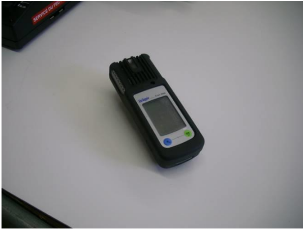
2 détecteurs de gaz