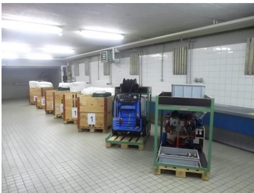
Mise à jour du matériel pour les épizooties