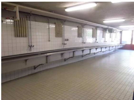
Remplacement du bassin à tuyaux et de son installation de contrôle qui dataient également de la construction de la caserne.