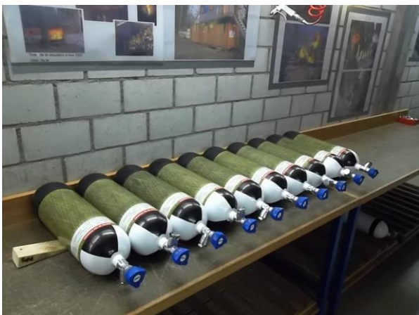
6 bouteilles d'une capacité de 6.8 l, en composite ainsi que 2 appareils respiratoires