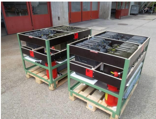
Aménagement de deux modules carburant pour les grandes interventions