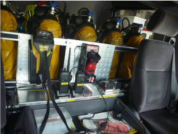
2 caméras thermiques

Et divers matériel pour l'intervention : 25 lampes, 50 sangles à tuyaux, 10 cordes de sauvetage et 2 cordes de sécurité PR.